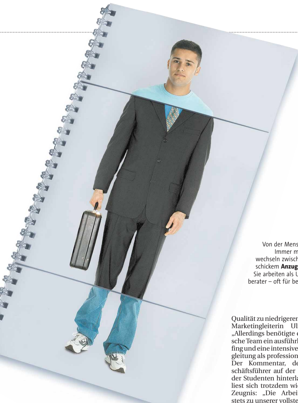
Von der Mensa ins Meeting: Immer mehr Studenten wechseln zwischen T-Shirt und schickem Anzug mit Krawatte . Sie arbeiten als Unternehmensberater – oft für bekannte Firmen